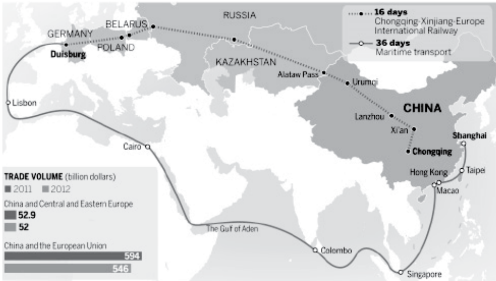
Рис. 1. Морський та наземний торговий шлях