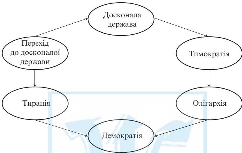
Мал. 1. Платонівський кругообіг державного устрою

аристократія, трудящі), поділ яких історично зумовлений виконанням різних соціальних функцій, що потребують різних здібностей і відповідають певним базовим цінностям.