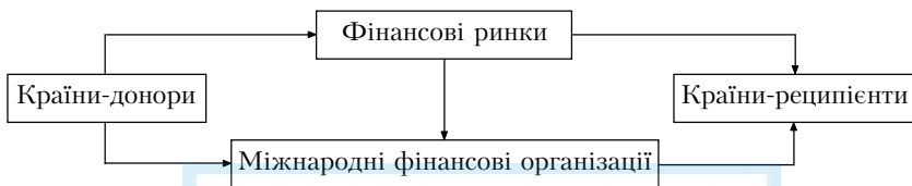
Рис. 2. Схема руху фінансових ресурсів за посередництва МФО

Офіційні фінансові ресурси через посередництво міжнародних фінансових організацій рухаються до країн-донорів (рис. 2).