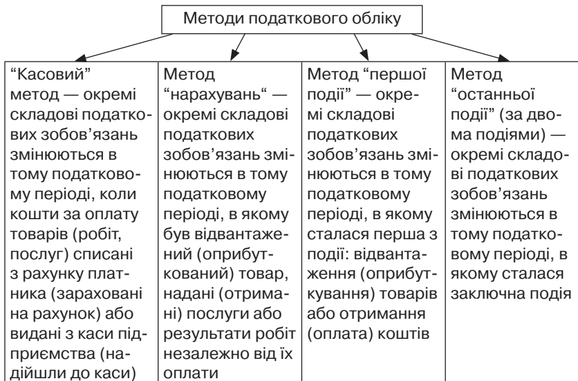
Рис. 1.1. Методи податкового обліку

У податковому обліку застосовується кілька методів: касовий метод; метод нарахувань; метод першої події; метод останньої події (рис. 1.1).